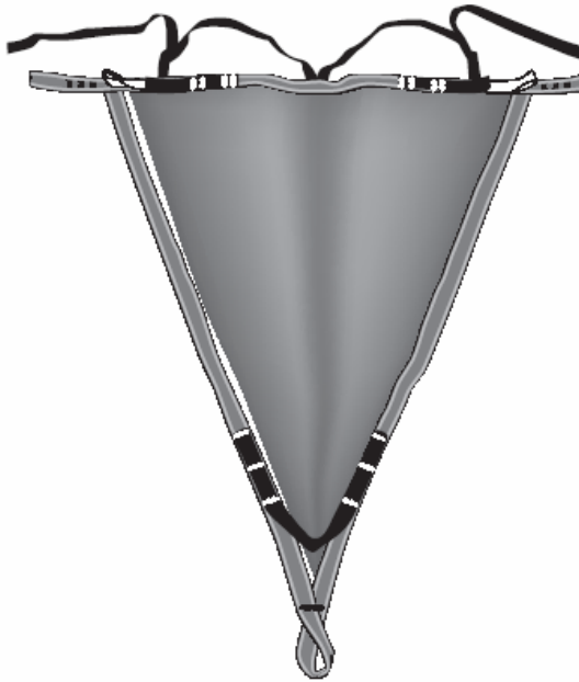
HT9 rescue triangle code 17622